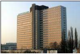
AGES PharmMed, Vienna

AGES – Gesundheit, Ernährung, Sicherheit, Unsere Verantwortung.