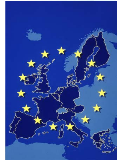
European Medicines Agency