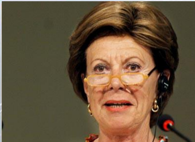
Neelie Kroes, European Commissioner for Competition

“The inquiry showed that originator companies use a variety of instruments to extend the commercial life of their products without generic entry for as long as possible.”